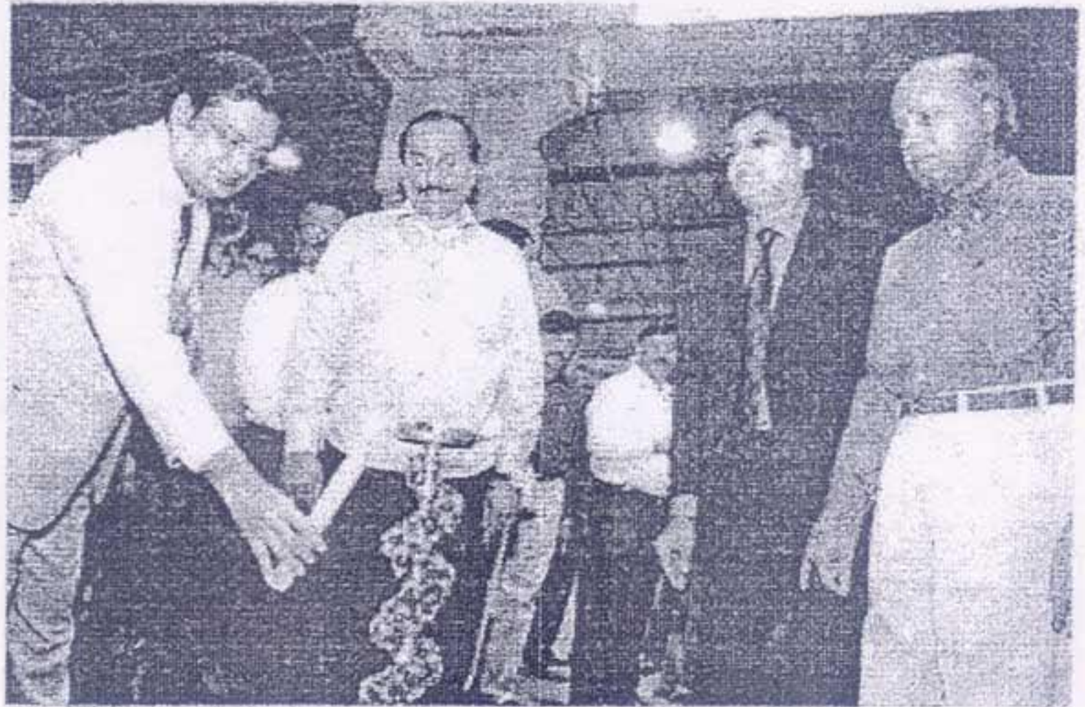
కార్యక్రమాన్ని ప్రారంభిస్తున్న దృశ్యం, చిత్రంలో మంత్రి గాలి జనార్దనరెడ్డి తదితరులు

నూచి రాత్రి 8 వరకు వీక్షించే అవకాశం కలదన్నారు. రాబోవు నెలల్లో టిటిఎఫ్ బెంగుళూరు ప్రదర్శన అనంతరం ముంబై, ఢిల్లీలో తమ ప్రదర్శన ఉంటుందన్నారు. 2011 ద్వితీయార్థంలో హైదరాబాద్, కలకత్తా, అహ్మదాబాద్, సూరత్లలో ఈ ప్రదర్శనలు ఏర్పాటు చేయదలిచామని తెలిపారు.