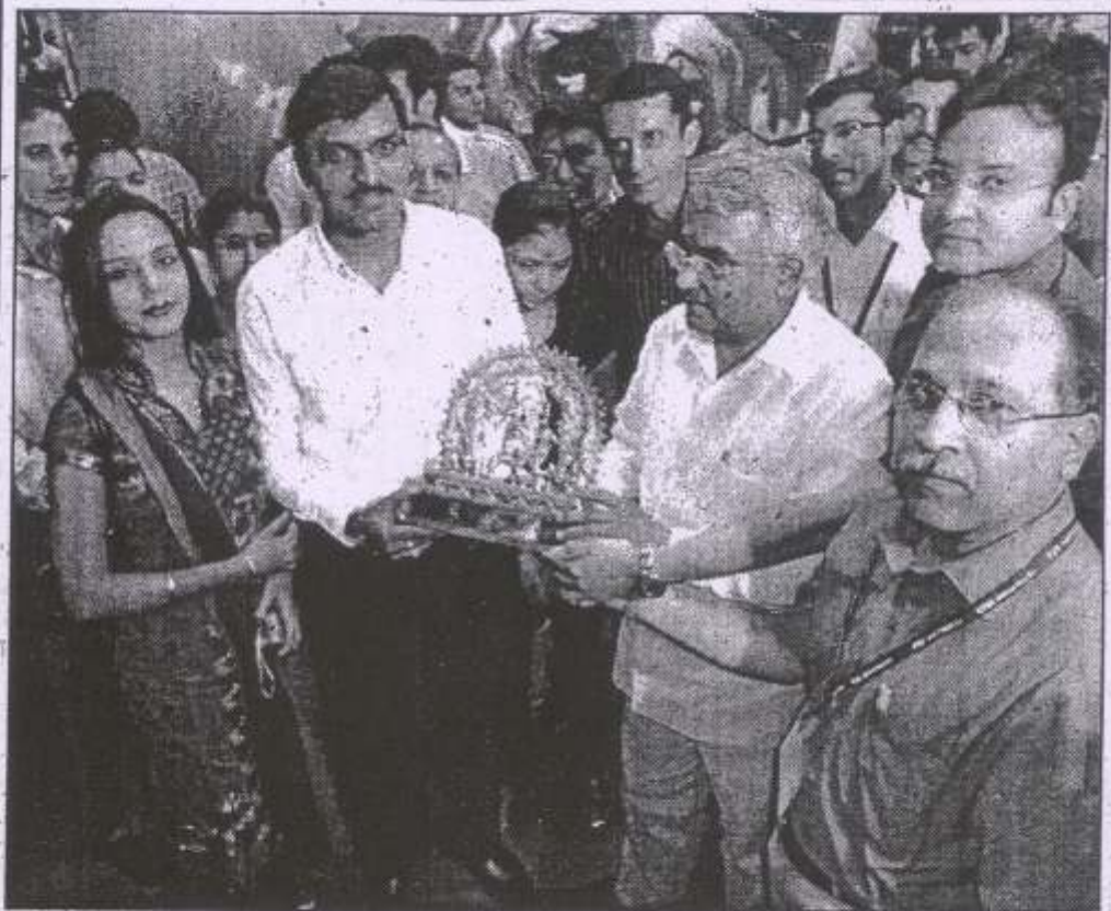
देहरादून : कोलकाता में आयोजित टी.टी.एफ. 2010 में उत्कृष्ट प्रदर्शन करने वाले प्रतिनिधियों को पुरस्कृत करते पर्यटन मंत्री मदन कौशिक। महामेंधा