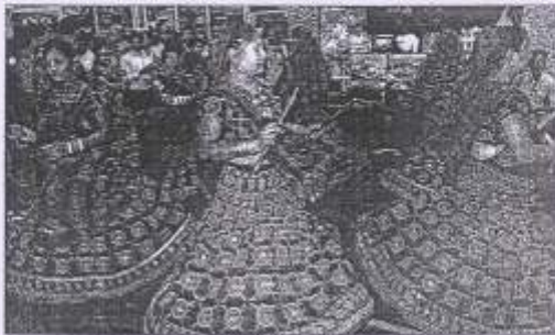
পার্বত্য দলের সদস্যরা। কাশ্মীর, হেরে গেল জঙ্গিদের বন্দুক।

শে-মাসে কোমার বা কোমার, কোমার বা কোমার অর্থাৎ বরং প্রায় প্রায়ইই উন্নত পর্যায়ে গিয়েছে বলে জানা গিয়েছে।